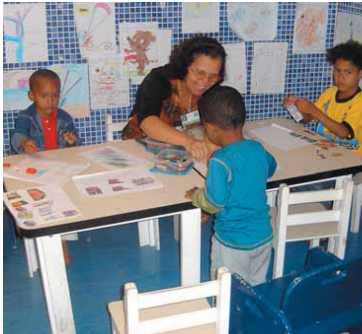
Espaço de recreação para crianças no Centro Médico da Apae