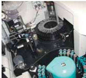
Tecnologia de ponta no Labac

Durante a implantação do novo modelo, a grande preocupação da Instituição foi não perder o seu foco principal que