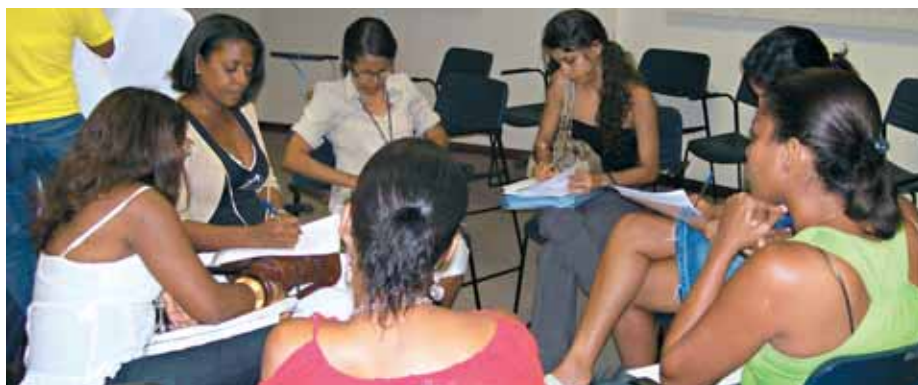
A I Oficina Pedagógica é uma das ações do programa de apoio à inclusão escolar, do Ceduc

O Centro Educacional Especializado (Ceduc) da Apae Salvador está ampliando, significativamente, o número de escolas que serão atendidas este ano pelo Programa de Apoio a Inclusão Escolar, que é desenvolvido pela Instituição. Implantado em 2006, o programa atendeu a 66 escolas das redes pública e privada, e destas, 10 escolas receberam assessoramento direto. Em 2007, a expectativa é atender a 99 escolas até o fim do ano.