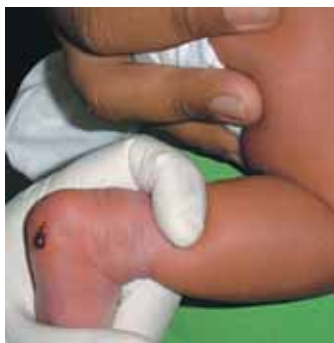
Prevenção: Teste do Pezinho

sófia de gestão empresarial-social. Fundamentada numa tecnologia empresarial, adaptada para instituições sem fins lucrativos e já testada com sucesso, o novo modelo consolidou os valores morais e possibilitou mudanças educacionais, científicas e financeiras.