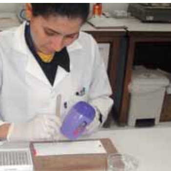
Laboratório é usado em pesquisas

De fato, todos os centros da Apae Salvador hoje desenvolvem ações e atividades relacionadas com a deficiência, sobretudo, a deficiência mental. Prova disso é a implantação do Núcleo de Pesquisa Científica, o NUPEC, criado com o objetivo de transformar o grande arsenal de dados, obtido através do atendimento médico e laboratorial da Instituição, em fonte permanente de pesquisa científica.