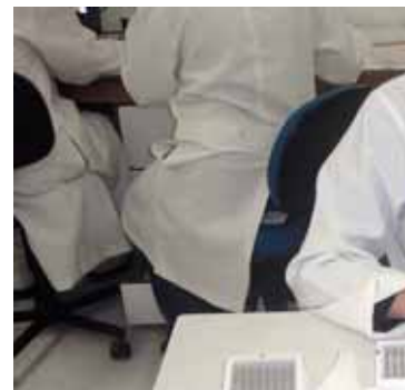
O material colhido pelos labora-

Além disso, o Cedip realizou trabalhos técnico-científicos para a validação do uso do papel de filtro como meio de coleta e armazenamento para a detecção do vírus da Aids. "Agora, em parceria com a FioCruz,