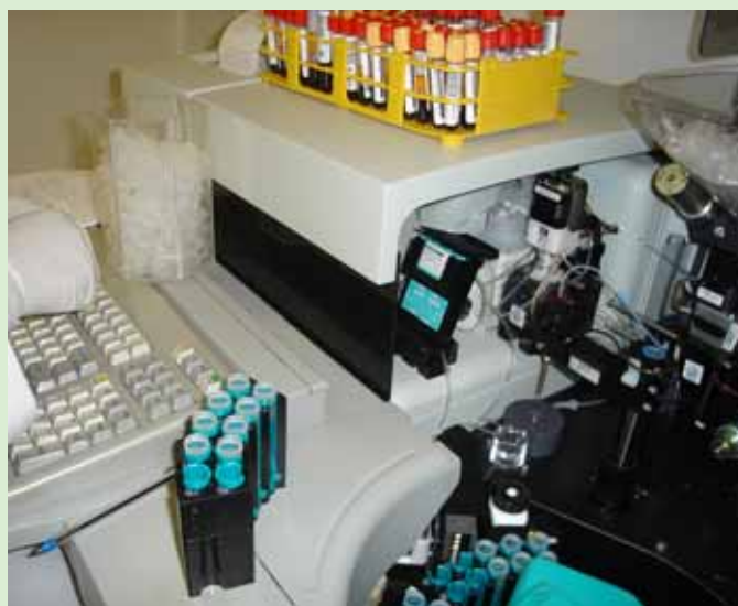
Novos equipamentos possibilitam agilidade nos exames