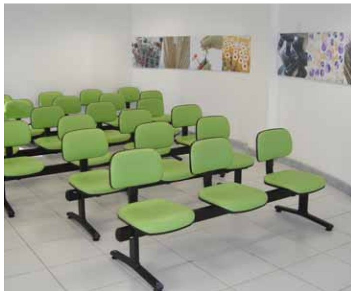
A recepção ficou mais espaçosa e charmosa