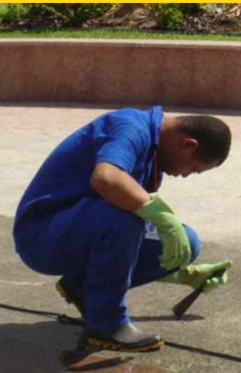
Auxiliar de Serviços Gerais