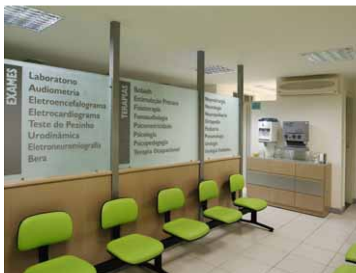
Sinalização de fácil assimilação