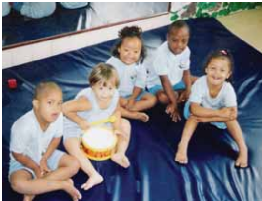
Meta é aumentar o número de crianças atendidas

O Ceduc também acompanha os educandos que estão inseridos na rede regular de ensino. Estas crianças freqüentam o Centro três vezes durante a se-