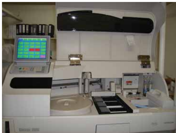
Tecnologia de ponta auxilia no diagnóstico

atendimento, este e seus exames específicos são identificados em um software que registra as informações em código de barras, otimizando o tempo de execução",