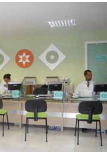
to ganhou novo visual

observa Carvalho. Outra ampliação verificada com a reforma do Labac foi o número de boxes para coletas de materiais que dobrou, contando com box específicos para coletas que exigem privacidade e outro box infantil.