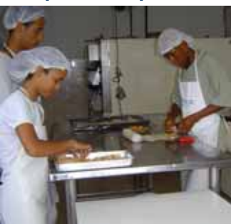
Com a mão na massa

de recursos junto à iniciativa privada para que possamos beneficiar cada vez mais um número maior de pessoas.", completa.