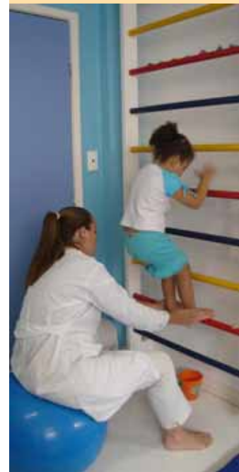
Reabilitação pós toxina botulínica

Instituição investe na consolidação dos serviços de saúde