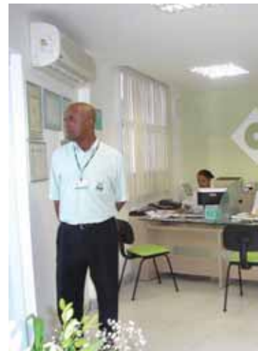
A área de atendimento

Brasileira de Análises Clínicas - SBAC e Sociedade Brasileira de Patologia Clínica - SBPC, obtendo sempre um conceito de excelência.