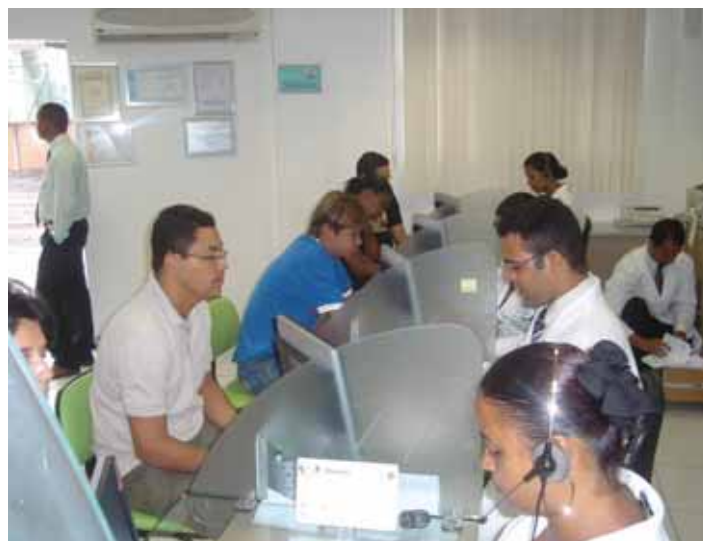
Atendimento rápido e de qualidade