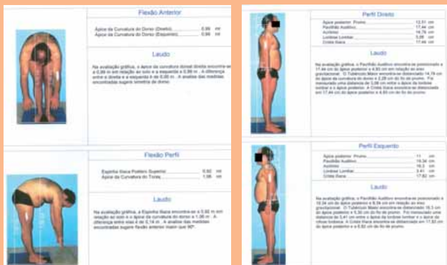
Exame detecta os principais problemas de coluna

“São várias as indicações para a realização do exame: avaliação dos desvios posturais, acompanhamento da evolução postural natural, acompanhamento da evolução postural durante ou após tratamento fisioterápico, método de exercício de pilates e academia de ginástica”, acrescenta o ortopedista, lembrando que é um exame não-invasivo, de baixo custo, prático e de fácil visualização. “O paciente terá maior conscientização do seu corpo e, com isso, poderá participar mais ativamente do tratamento”, afirma. Através do APC problemas como escoliose, hipercifose torácica, hiperlordose lombar, ombros anteriorizados, cabeça exageradamente projetada para frente, torsões na bacia, joelhos valgus ou varos e pés planos têm suas causas facilmente detectadas.