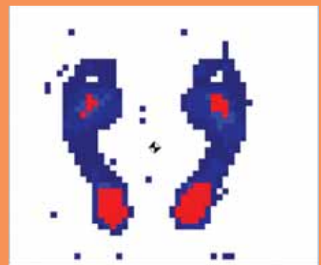
Exame detecta problemas nos pés

Através da plataforma baropodométrica é possível estabelecer o padrão postural do paciente e o seu centro gravitacional, avaliando as oscilações posturais e de equilíbrio. As alterações nos padrões posturais podem originar dores na região lombar, quadris, joelhos, tornozelos e pés. Na área da prevenção, o exame é de grande ajuda para o paciente diabético, uma vez que pode detectar os pontos de maior pressão nos pés.