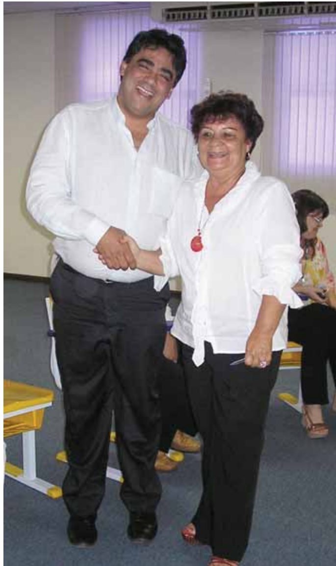
Santo Antônio de Jesus é o primeiro município a aderir ao programa Pré-Natal em papel filtro

A nova técnica de coleta e análise de exame em gestantes foi validada em 2005, pelo Serviço de Referência em Triagem Neonatal (SRTN) da Apae Salvador, serviço credenciado pelo Ministério da Saúde para realização do Teste do Pezinho no estado. Além de reduzir o custo do exame em cerca 30%, a técnica do papel de filtro reduz as despesas com material de coleta, armazenamento (acondicionamento de tubos de ensaio em gelo) e transporte do material biológico,