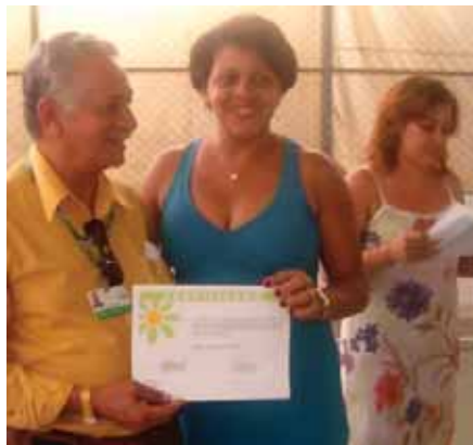
Presidente prestigia cerimônia

O projeto ofereceu qualificação profissional através dos cursos de costura; lanches comerciais; higienização de ambientes; consertos e ajustes de roupas; artesanato comercial e penteados afros. Com duração de 40 dias, os cursos de