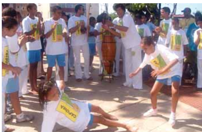
Capoeira foi uma das oficinas que animou a manhã ensolarada

10h, no Centro de Formação e Acompanhamento Profissional (Cefap) foi realizada a solenidade de adesão da instituição ao projeto Salvador, Cidade das Letras . Promovido pela Prefeitura Municipal de Salvador em parceria com o Programa Brasil Alfabetizado, do Ministério da Educação (MEC) e entidades da sociedade civil organizada, o projeto tem o objetivo de reduzir os índices de analfabetismo na capital baiana. Foram matriculados 38 aprendizes do Cefap, duas mães de alunos, duas pessoas da comunidade e oito funcionários. No dia 28, às 14h, os alunos da Cia Opaxorô realizaram uma apresentação para os idosos do Abrigo D. Pedro II.