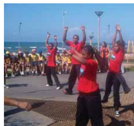
Dança e música marcaram o encontro na Pituba