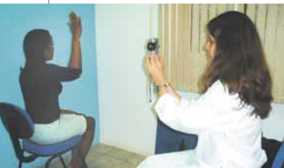
Articulações são avaliadas no exame

A forma computadorizada mensura e quantifica os ângulos articulares por meio de imagens digitalizadas e emite laudos com fotos e avaliação gráfica do paciente. O laudo médico passa a contar com o ângulo medido, o valor padrão, a variação padrão, os músculos que são responsáveis pelo movimento, a inervação e o percentual de limitação.