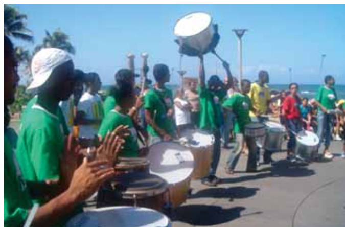
Alunos, professores e colaboradores participam das atividades na Praça Nossa Senhora da Luz

Com o tema Acessibilidade: um caminho para a inclusão , a programação teve início em 21 de agosto, às 8:30h, com um seminário, realizado na sede da Instituição, na Pituba. O encontro, dirigido aos profissionais da área, foi estendido aos professores da rede municipal de