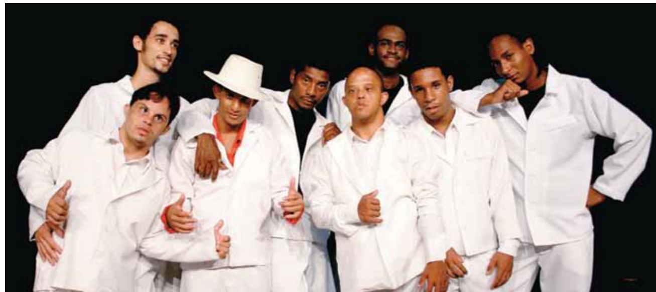
O espetáculo Ópera do Malandro é um dos grandes sucessos do grupo

Composta por alunos e aprendizes com deficiência intelectual, a Opaxorô é exemplo de método de ensino eficiente