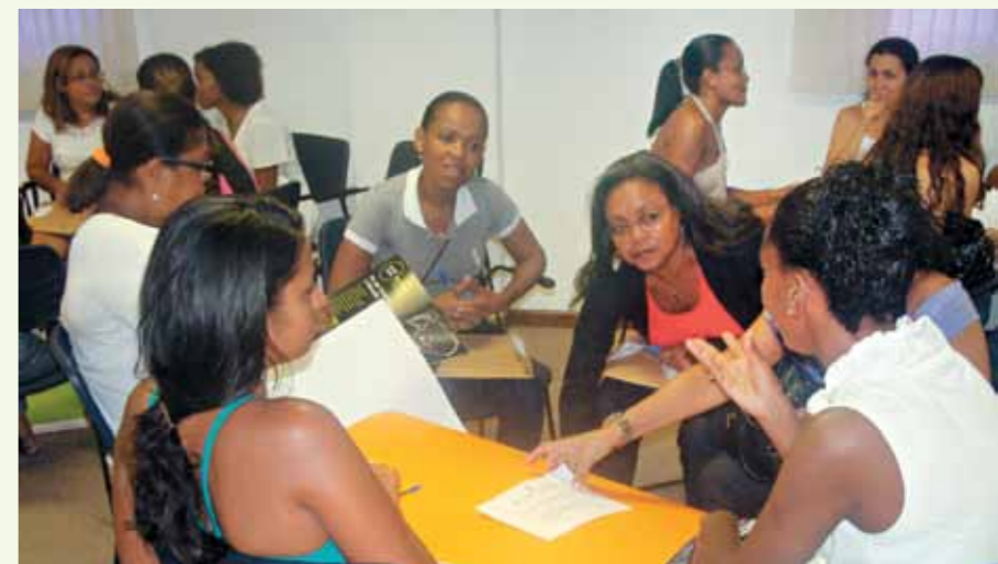
Através de oficinas, os profissionais aprendem a lidar melhor com as classes inclusivas

Esse novo cenário impulsionou as escolas regulares a buscarem referência nas antigas escolas especializadas e nos programas desenvolvidos pelas instituições para transferir experiência adquirida ao longo dos anos no atendimento aos alunos com deficiência intelectual. Nessa perspectiva, o Programa de Apoio à Inclusão Escolar, desenvolvido pelo Ceduc, promoveu, em 2010, uma ampla programação para a capacitação de professores, gestores e outros profissionais da área de educação que atuam em classes inclusivas das redes pública e privada de ensino.