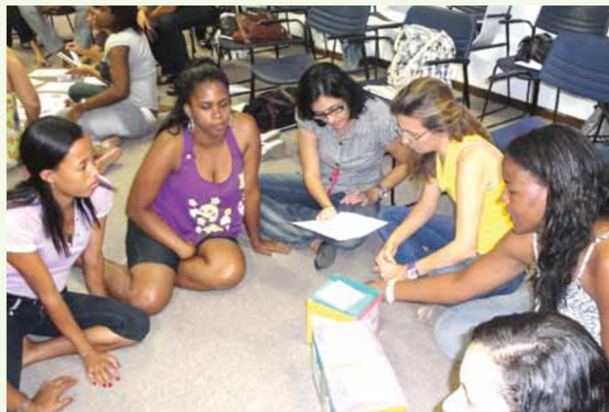
Professores participam das oficinas pedagógicas

Para superar essas barreiras, o programa desenvolve ações também junto às famílias, como os plantões pedagógicos, seminários e encontros, entre outros eventos, a exemplo do que aconteceu no seminário intitulado Famílias de mãos dadas com a inclusão . Também são realizadas ações através do Núcleo de Serviço Social, que auxilia as famílias a compreenderem a resignificação do espaço educacional do Ceduc, como AEE, e que acabam por contribuir para a aceitação da escola comum, com seus limites e possibilidades.