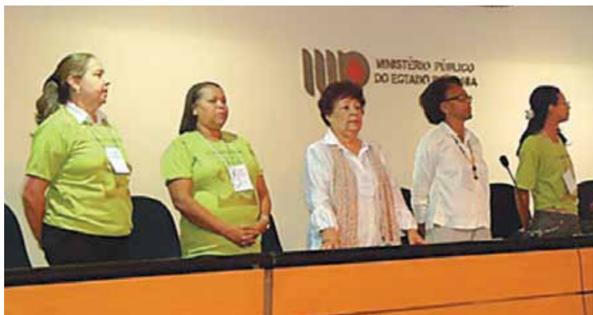
As famílias dos alunos puderam esclarecer dúvidas e receber orientações