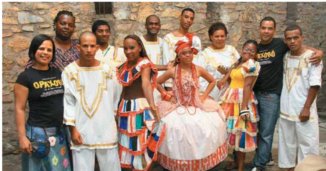
Em Contando Histórias os aprendizes resgatam ritmos da música nordestina